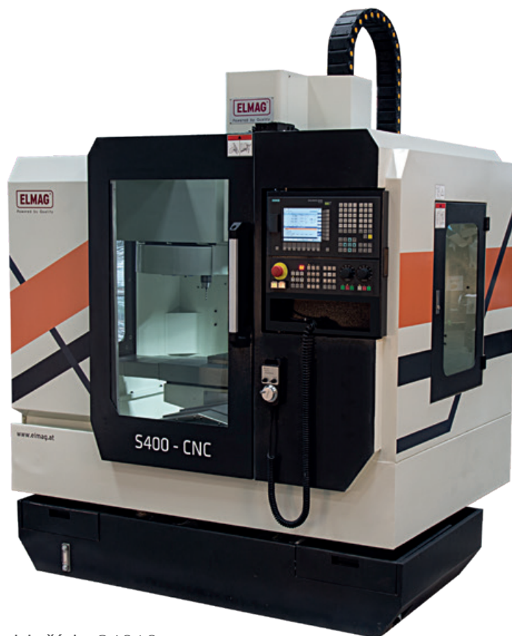
obj. číslo 84010