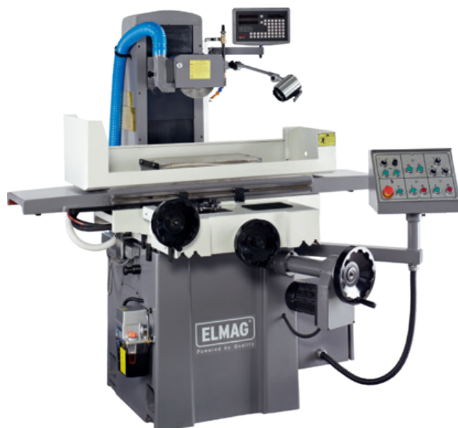
obj. číslo 82603