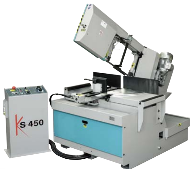
KS 450 ESC