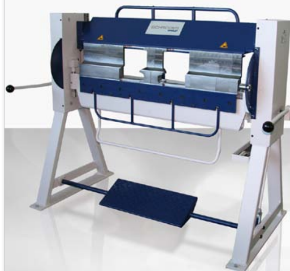
ASK II 1000 x 2,0