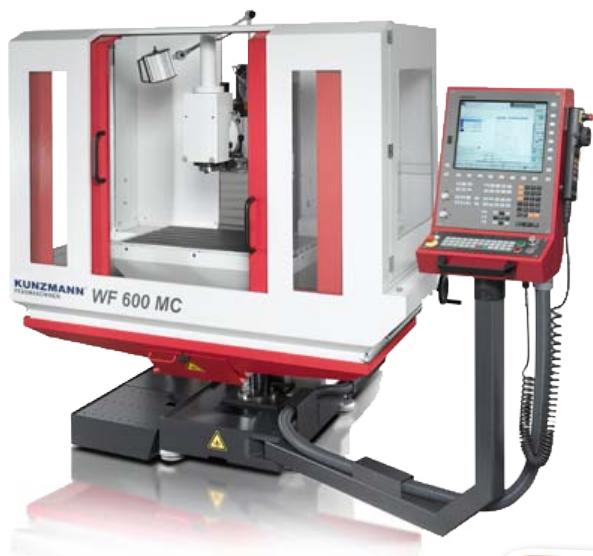
WF 600 MC TNC 620