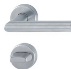
obj. č. 102 202 975 WC