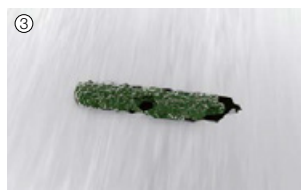
③ zárodky sú zničené