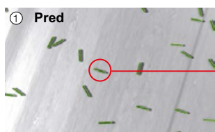
① Pred vysoké bakteriálne zaťaženie na povrchu